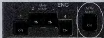
图2 A380备份控制工作模式开关

A380发动机的备份控制工作模式方案是遵从空客驾驶舱设计理念,以电脑的自动判断和控制为主要手段的设计,不需要飞行员更多的判断和人工操作。A380发动机的备份控制工作模式开关非常简单,为单层按压开关,开关上的标识为ON,如图2所示,一个开关控制A380的四台发动机。